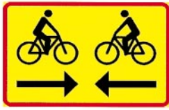
863. Kaksisuuntainen pyörätie