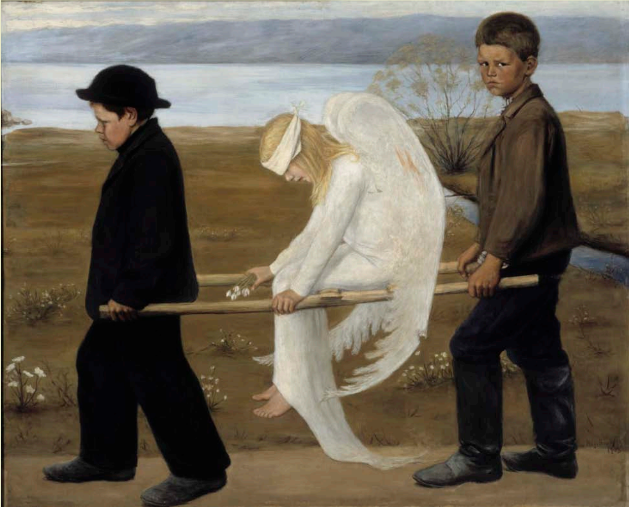
Hugo Simberg, Haavoittunut enkeli, 1903