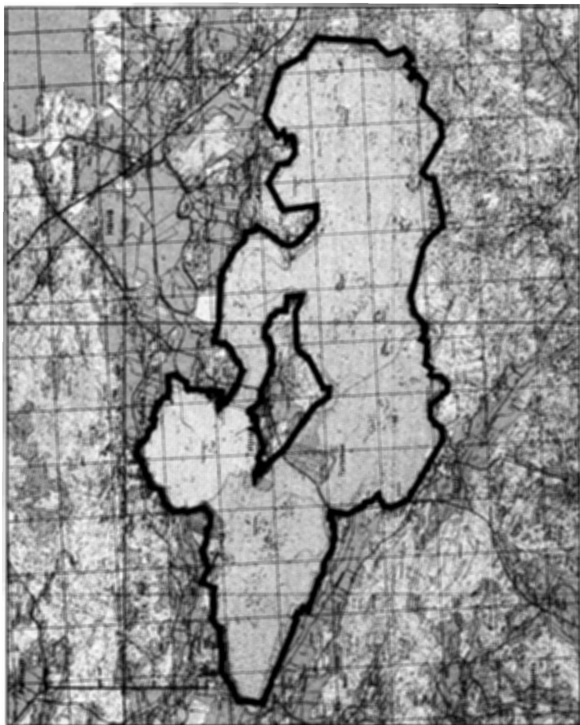
LIITE TORRONSUON KANSALLISPUISTON RAJAUS VALTONEUVOSTON PERIAATEPÄÄTÖKSEN MUKAAN