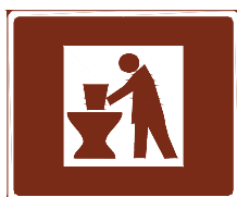
774 d. Hantverkarverkstad