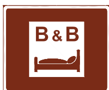
774 b. Rum och frukost