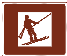
773 c. Skidlift