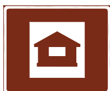
774 a. Stuginkvartering