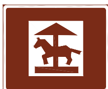
773 e. Nöjes- eller temapark