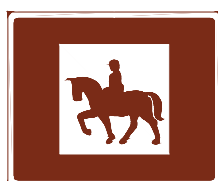
774 f. Ridning