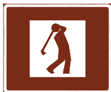
773 d. Golfbana