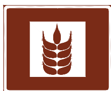
774 c. Direktförsäljning