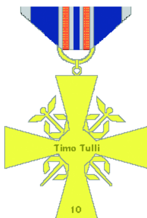
Reversen av tullverkets förtjänstkors