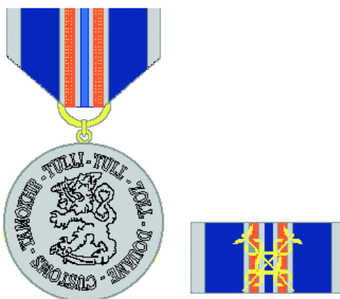
Reversen av tullverkets förtjänstmedalj