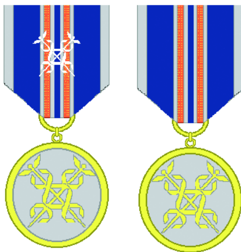
Tullverkets förtjänstmedalj med spänne och förtjänstmedalj